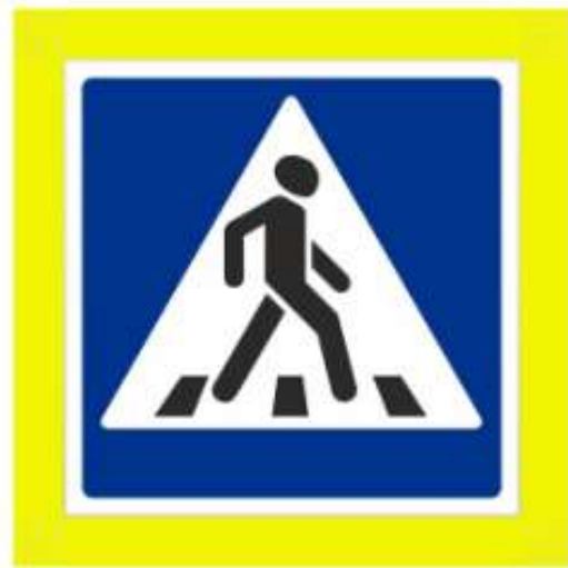
Знак пешеходного перехода