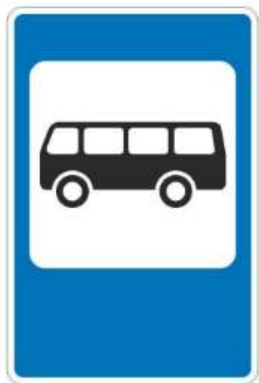
Знак остановки транспорта

Здесь останавливается общественный транспорт, это знак остановки.