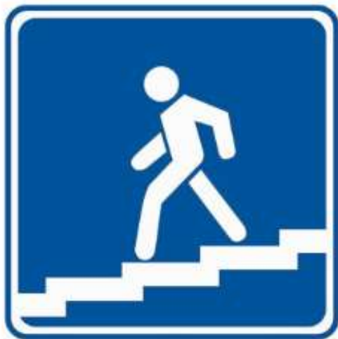
Знак подземного перехода

Здесь есть подземный переход, рядом оживлённая трасса, преодолеть которую можно под землёй.