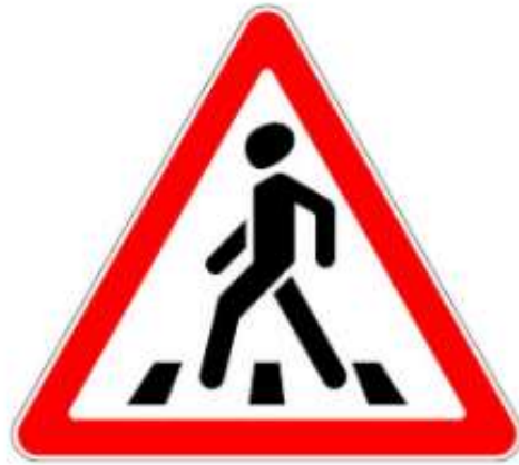
Знак перехода рядом

Где есть это обозначение, МОЖНО переходить дорогу. Это разрешающий знак.