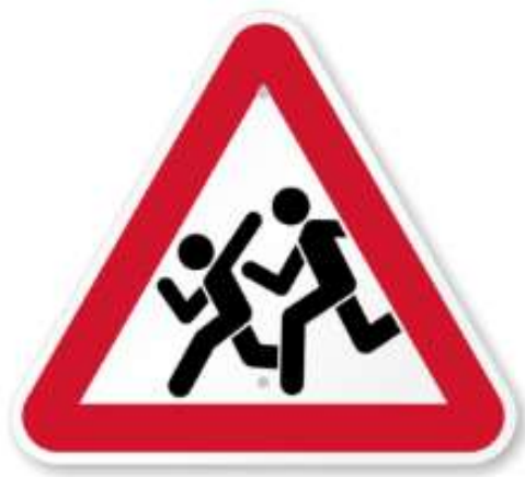
Знак дети рядом

Это обозначение для водителей, чтобы они знали, что рядом могут быть дети. Такие знаки устанавливаются рядом со школами, детсадами, другими детскими учреждениями.